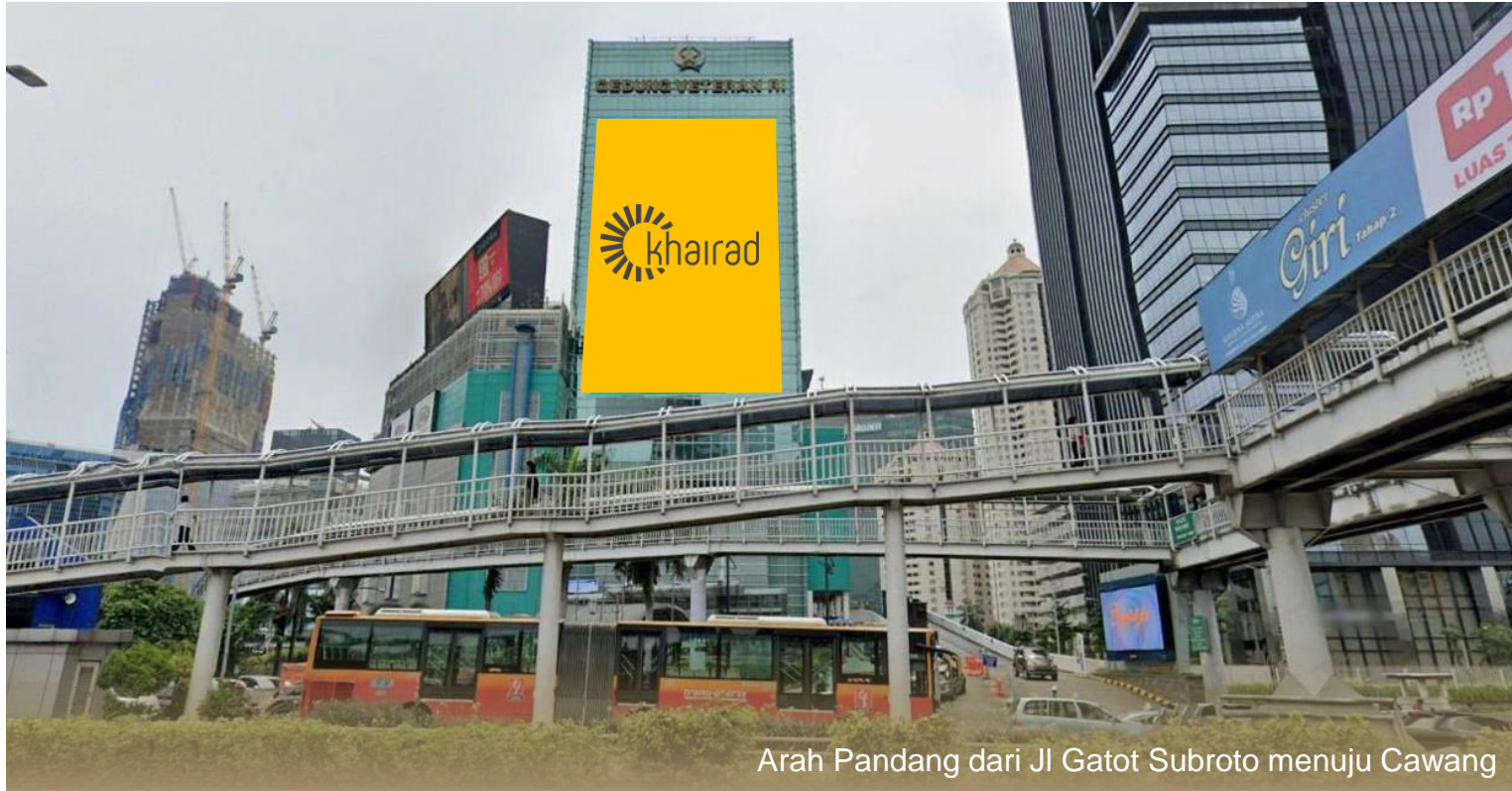
Arah Pandang dari Jl Gatot Subroto menuju Cawang